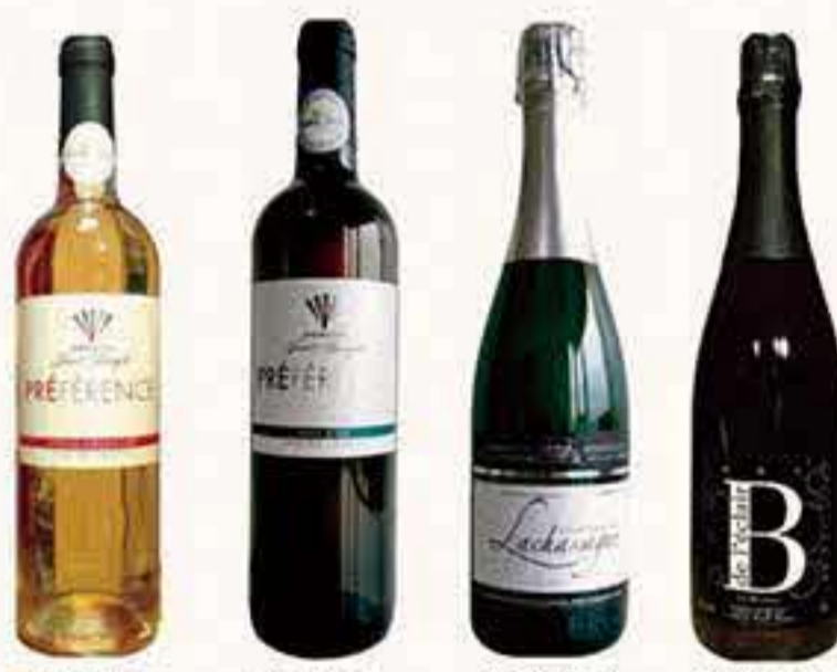
寶石桃紅 美斯干白 勃艮第白香檳式汽酒 勃艮第紅香檳式汽酒