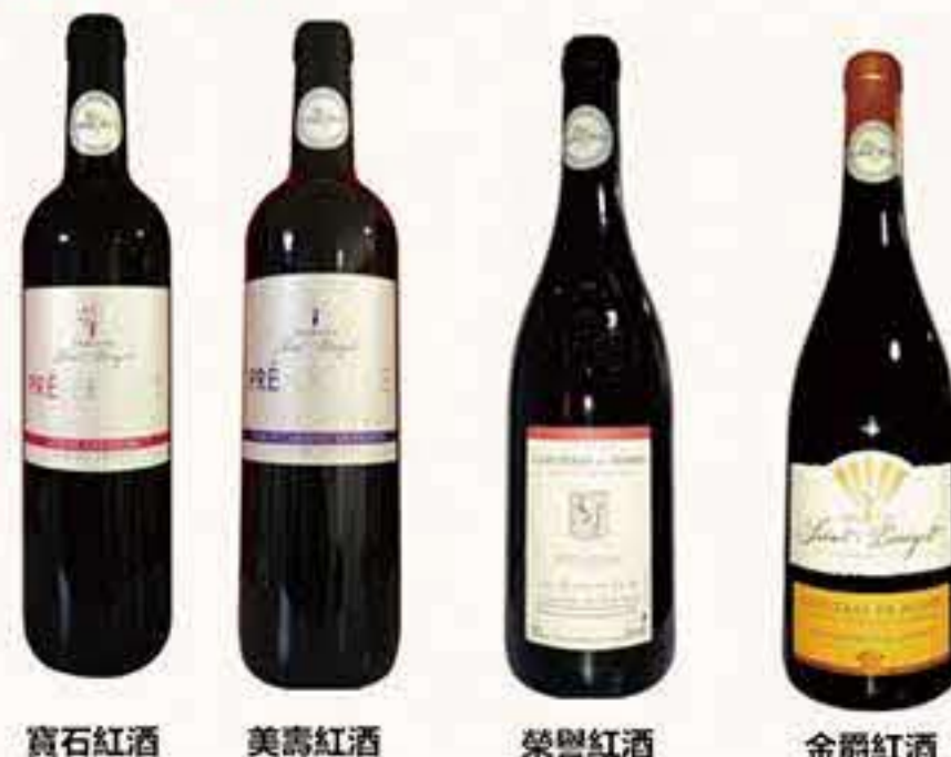
寶石紅酒 美壽紅酒 榮譽紅酒 金爵紅酒