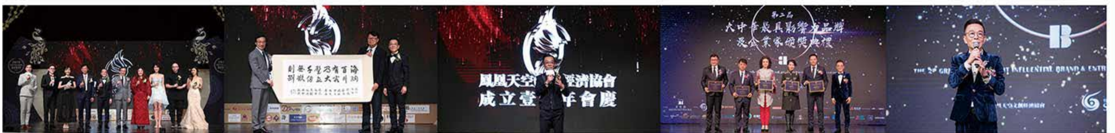
第一屆與第二屆大中華最具影響力品牌及企業家頒獎典禮-活動圖

協會已成功主辦兩屆“大中華最具影響力品牌及企業家頒獎典禮”，集中大中華商業資源，形成全澳具有話題性及極高商業影響力的大型活動。未來，鳳凰天空文創經濟協會亦將涉足更多文化產業領域，為澳門文創事業開拓更寬闊的視野及更廣闊的市場。